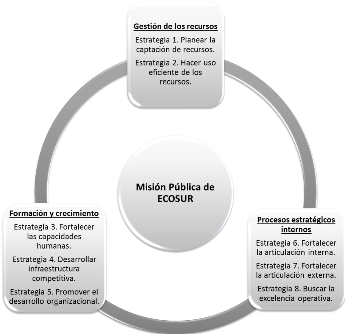
Figura 3. Perspectivas y estrategias transversales del PEMP

Cada estrategia transversal del PEMP tiene vínculos con algunas estrategias mencionadas en el PECiTI (figura 4). Esta relación da cuenta del nivel de precisión con el que ECOSUR ha planeado sus actividades para coadyuvar al cumplimiento de las Metas Nacionales, y además, anticiparse a las acciones derivadas de los programas del PECiTI y del Programa Institucional del CONACYT para obtener mejores resultados y generar mayores beneficios.